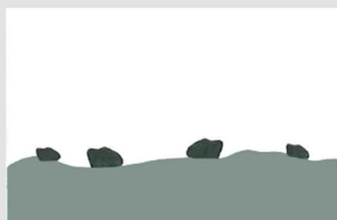
Superficie con particelle di sporco.